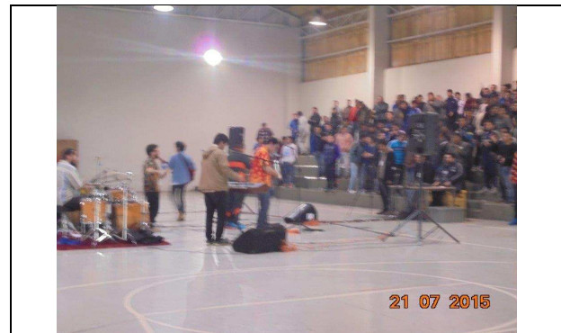
IMG. N° 001 Reinserción Social: Sub Programa Deporte, Recreación, Arte y Cultura, EP. Santiago 1.

El día 21.07.15 se realizó evento artístico en Gimnasio del Establecimiento, en el cual se presentó la banda musical "Por aquí pasan aviones". Los módulos invitados fueron el 33 y 34, con un total de 115 imputados de acuerdo a cuenta de deserción.